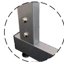
skruer i fod